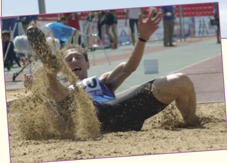
В. Железняков: из серии «Ст@дион»

фотографами из городов: Чебоксары, Йошкар-Олы и Новочебоксарска, а позже состоялся мастер-класс с фотолюбителями спортивной фотографии. И еще одно немаловажное событие: ветераны спорта из Новочебоксарска решили оказать содействие музею города в формировании исторического раздела «Физкультура и спорт».