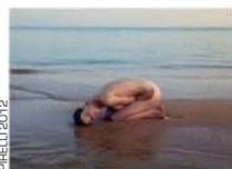
MARIO SORRENTI/ PIRELLI 2012

Создателем уже 39-го выпуска культового календаря Pirelli стал итальянец Марио Сорренти/Mario Sorrenti, в настоящее время живущий в Нью-Йорке. Двенадцать обнаженных моделей фотографа вписал в изысканные пейзажи Корсики, гармонично подчеркнув женскую красоту совершенством природы. МАММ/МДФ представляет выставку в рамках «Фотобиеннале-2012».