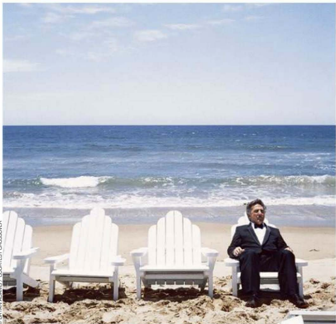
JUSTIN LICERMAN, MAIBULI PROSE, © BRYAN ADAMS / COURTESY CROSSOVER